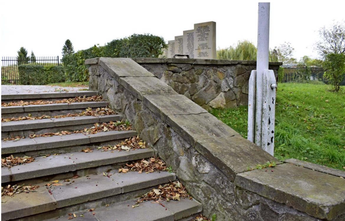
Cmentarz wojenny Wzgórza Krzesławickie: Balustrada schodów – ubytki tynku, spoinowania, zabrudzenia kamienia