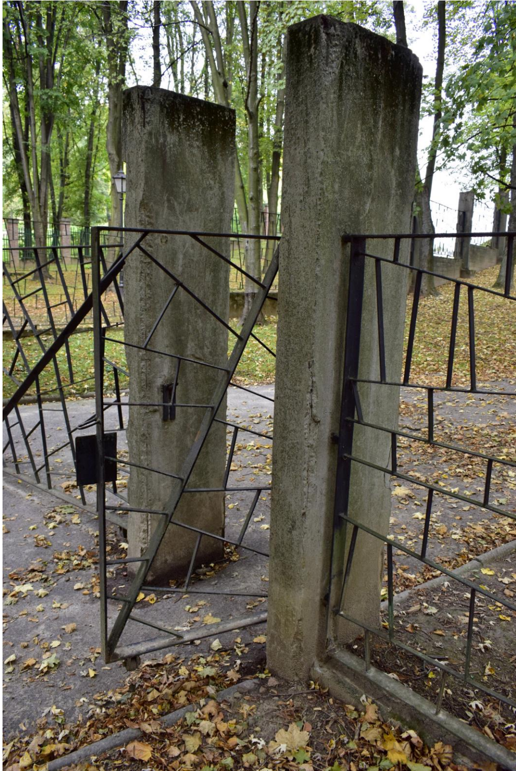
Cmentarz wojenny Wzgórza Krzesławickie: Ogrodzenie - korozja, ubytki betonu