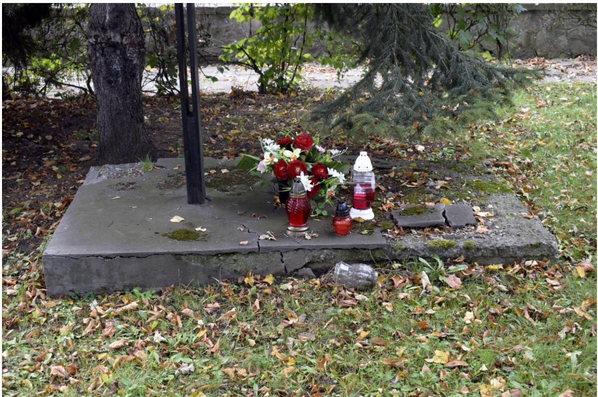
Cmentarz wojenny Wzgórza Krzesławickie: Nagrobek z metalowym krzyżem, ubytki betonu, korozja krzyża