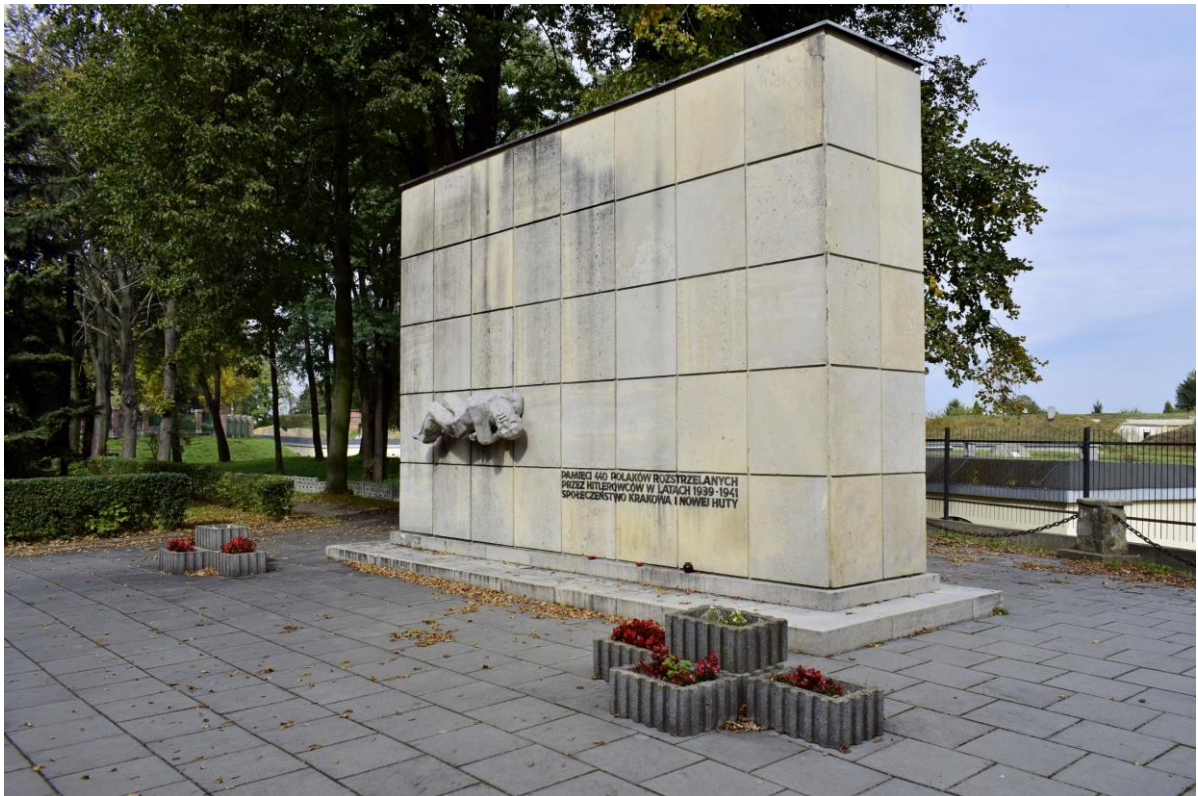
Cmentarz wojenny Wzgórza Krzesławickie: Pomnik pomordowanych widoczne zacieki na okładzinie kamiennej