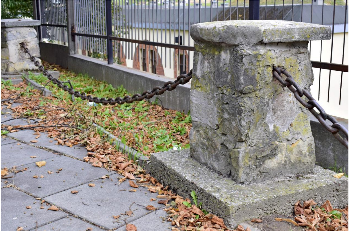
Cmentarz wojenny Wzgórza Krzesławickie: Słupki odgradzające z łańcuchami – ubytki tynku, korozja biologiczna, korozja metalu